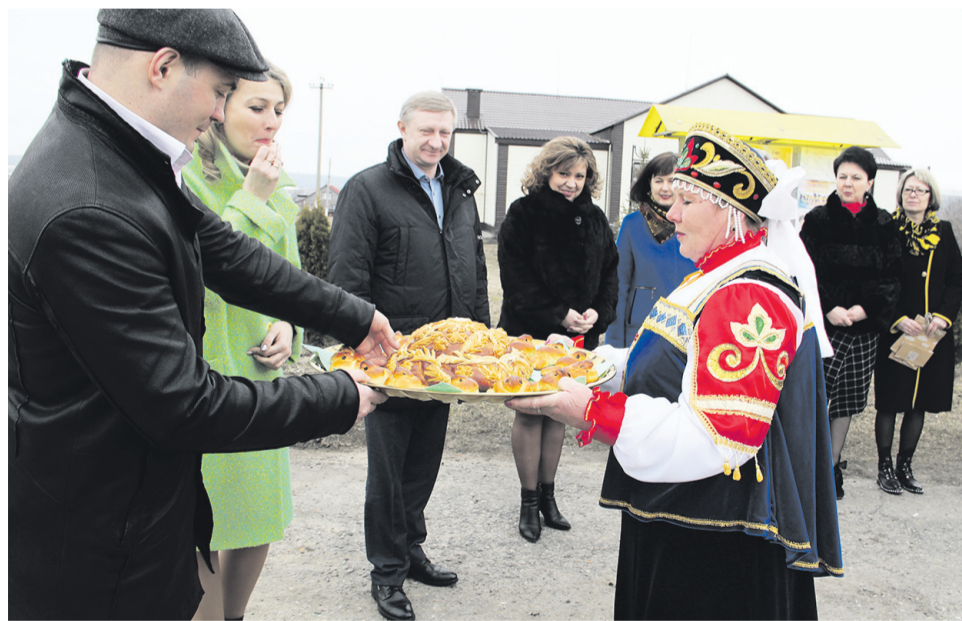
Встречали гостей по-русски, хлебом-солью