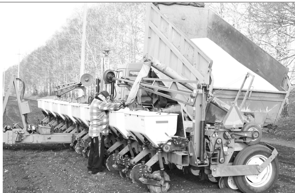
Дозаправка сеялки удобрениями при севе подсолнечника

Если говорить о последней, то некоторые из читателей могли о ней слышать или читать. Хотя бы у того же Пушкина. Это не просто сорт пшеницы, а целая группа сортов, включающая в себя девять видов, среди кото-