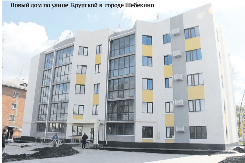
Новый дом по улице Крупской в городе Шебекино