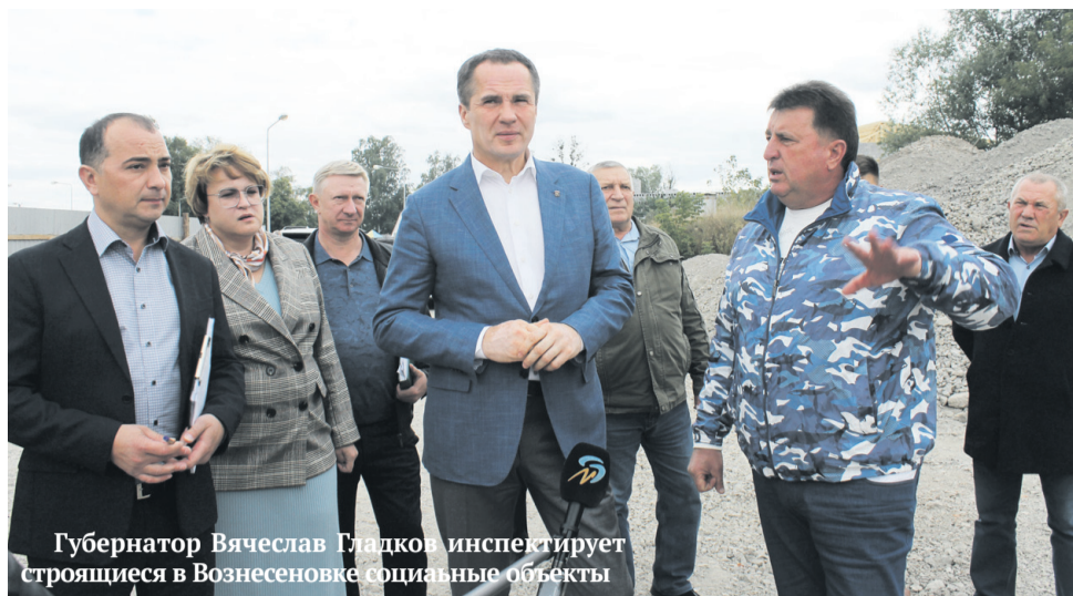
Губернатор Вячеслав Гладков инспектирует строящиеся в Вознесеновке социальные объекты