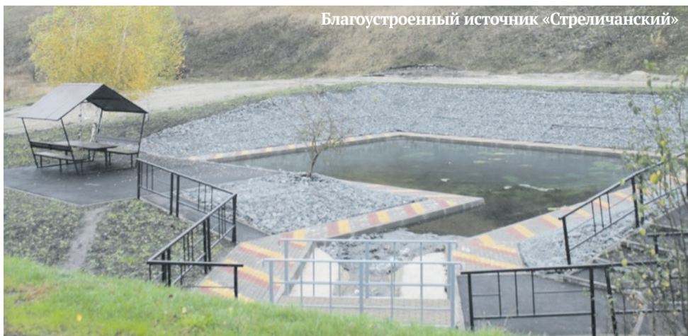
Благоустроенный источник «Стреличанский»

Вячеслав Гладков – социально ориентированный руководитель региона. Вся его работа направлена, прежде всего, на помощь жителям Белгородской области, на повышение качества их жизни. И мы не сомневаемся, что он и дальше будет держать этот верный курс. Именно за это он успел заслужить уважение и доверие людей.