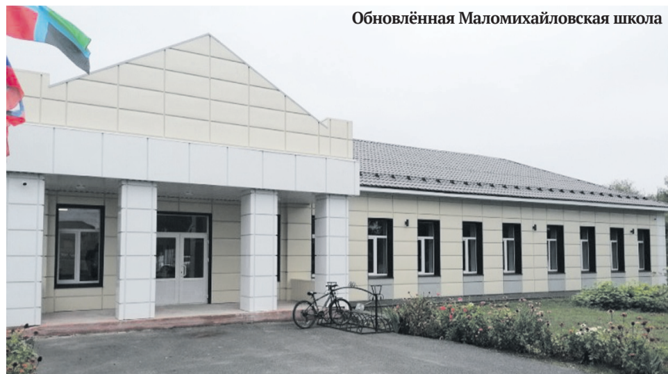
Обновлённая Маломихайловская школа