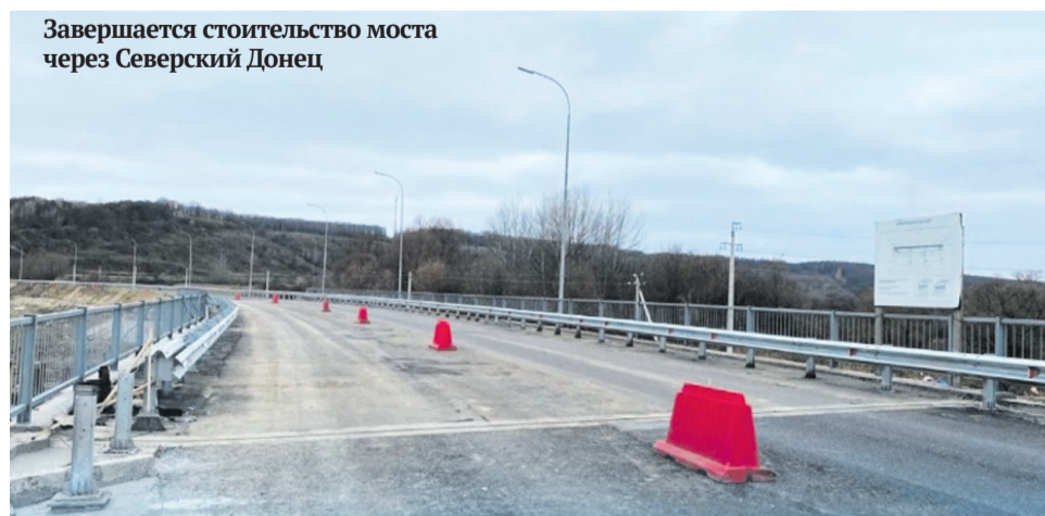
Завершается строительство моста через Северский Донец