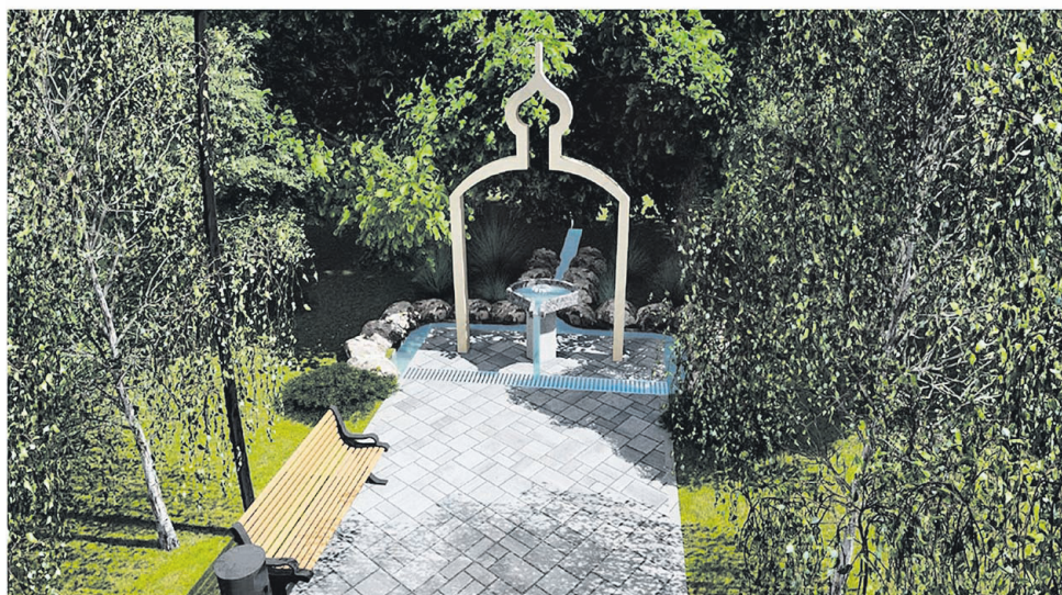
Эскизный проект благоустройства родника Белгородская обл., Шебекинский городской округ, с. Вознесенка