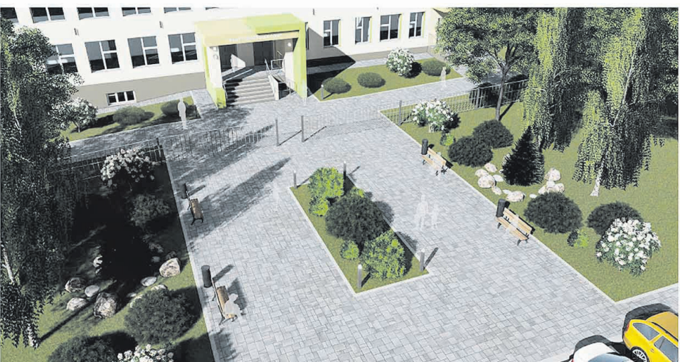
Эскизный проект зоны рекреации по ул. Центральная в с. Поповка