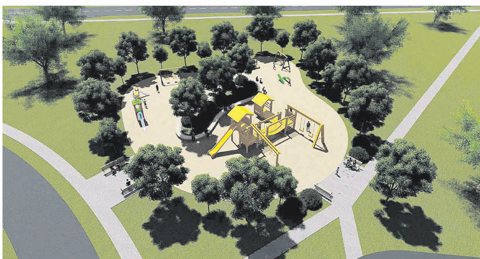
ЭСКИЗНЫЙ ПРОЕКТ ДОСУГОВОЙ ПЛОЩАДКИ ДЛЯ ДЕТЕЙ И ПОДРОСТКОВ ПО УЛ. ЧАПАЕВА В Г. ШЕБЕКИНО