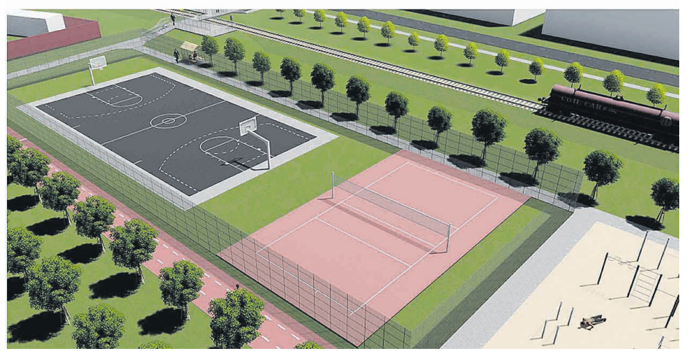
Эскизный проект по благоустройству территории сквера по ул. Герцена в г. Шебекино