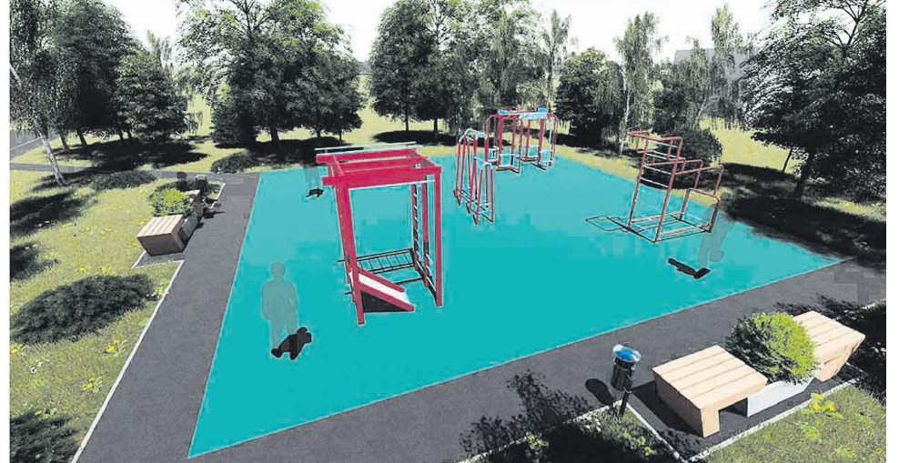
Эскизный проект досуговой площадки для детей и подростков по ул. Гагарина в с. Красная поляна