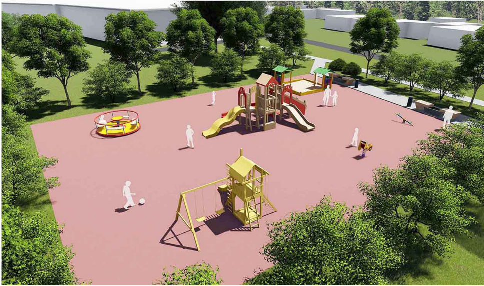
Эскизный проект досуговой площадки для детей и подростков по ул. Советская в с. Никольское