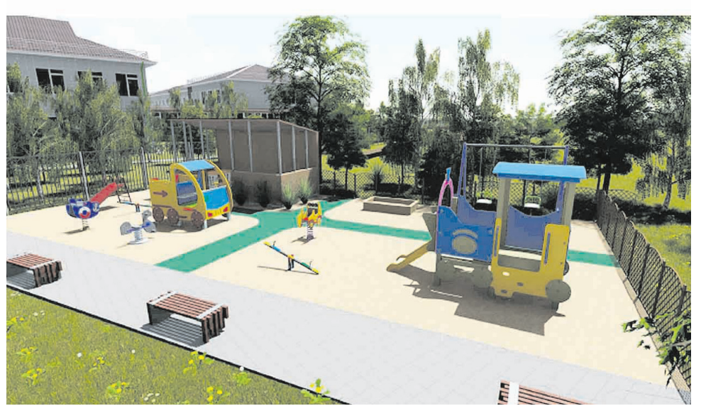
Эскизный проект досуговой площадки для детей и подростков по ул. Комсомольская в с. Максимовка