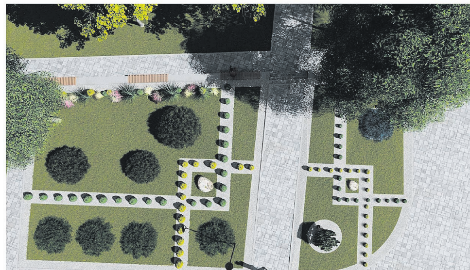
ЭСКИЗНЫЙ ПРОЕКТ БЛАГОУСТРОЙСТВА ТЕРРИТОРИИ ПРИЛЕГАЮЩЕЙ К МАГАЗИНУ "ЗДОРОВЫЙ ПРОДУКТ" РАСПОЛОЖЕННОЙ В Г. ШЕБЕКИНО УЛ. ГЕНЕРАЛА ШУМИЛОВА