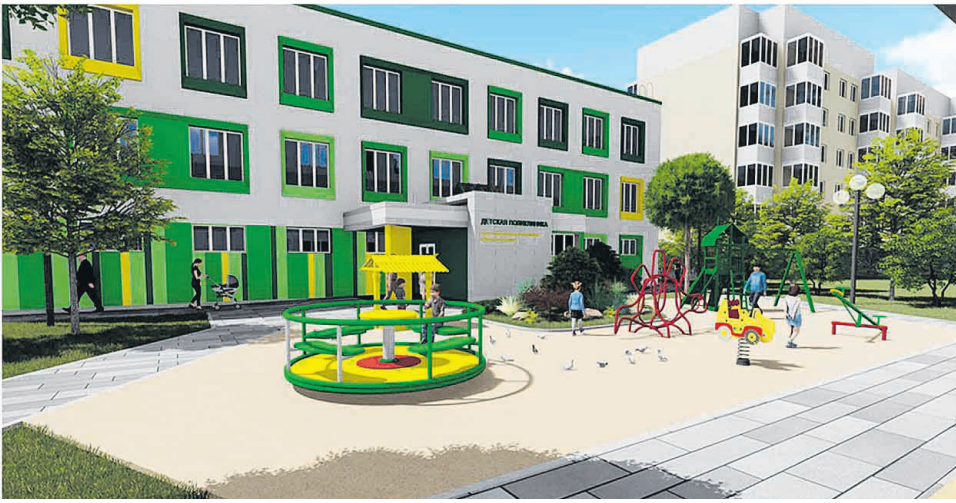
Эскизный проект досуговой площадки для детей и подростков по ул. Луговая в г. Шебекино