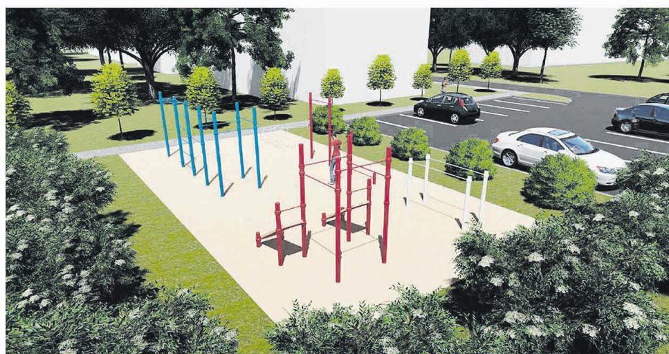
ЭСКИЗНЫЙ ПРОЕКТ ПО БЛАГОУСТРОЙСТВУ ТЕРРИТОРИИ ПО УЛ. ВОЛОДАРСКОГО В Г. ШЕБЕКИНО