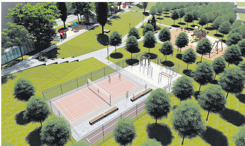
ЭСКИЗНЫЙ ПРОЕКТ БЛАГОУСТРОЙСТВА ТЕРРИТОРИИ Белгородская обл., г. Шебекино, ул. Дзержинского, д. 5